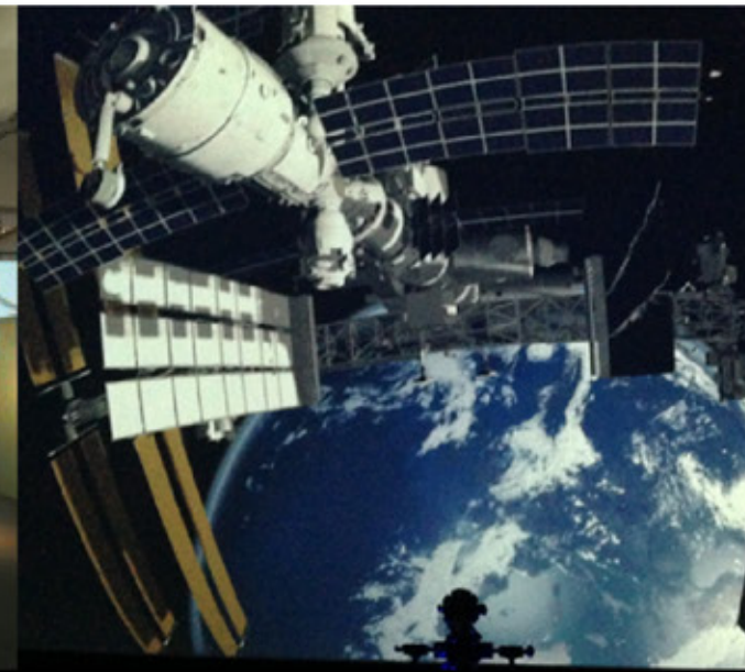
IMMERSIVE 360° KUPPEL